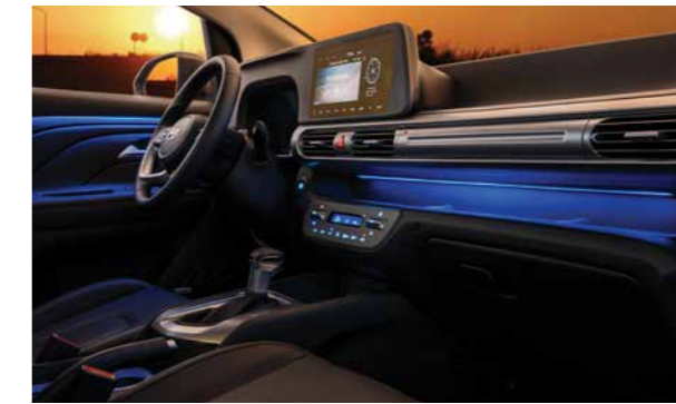
Đèn viền nội thất giúp trang trí và giúp định hướng vị trí vào buổi tối