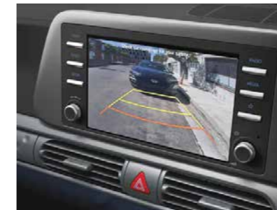
Camera lùi góc rộng hỗ trợ đỗ xe