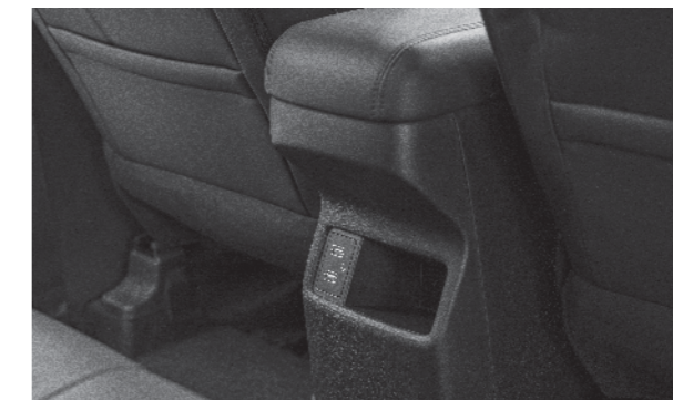
Cổng sạc và khay đựng đồ được bố trí ở tất cả vị trí ngồi