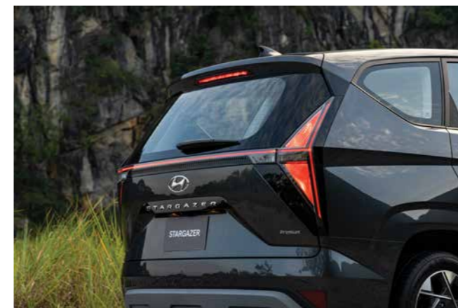
Cụm đèn hậu dạng chữ H dễ nhận diện ở tất cả các phiên bản

Các đường cong mềm mại tạo ra các mảng tách biệt toát lên hình ảnh thể thao.