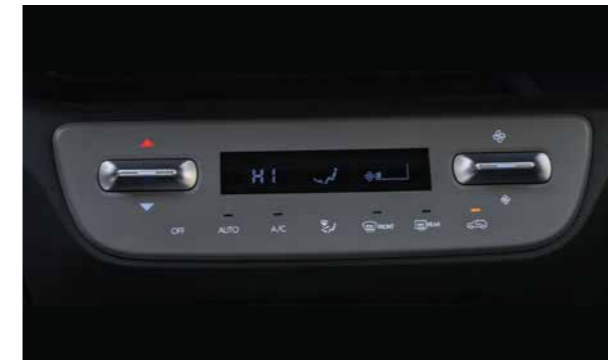
Điều hoà tự động với nút bấm cảm ứng và lẫy gạt trên phiên bản cao cấp giúp cho chiếc xe được tăng thêm tính tiện nghi