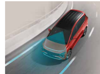
Cảnh báo lệch làn đường