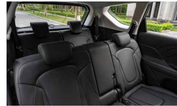
Không gian nội thất rộng hàng đầu phân khúc