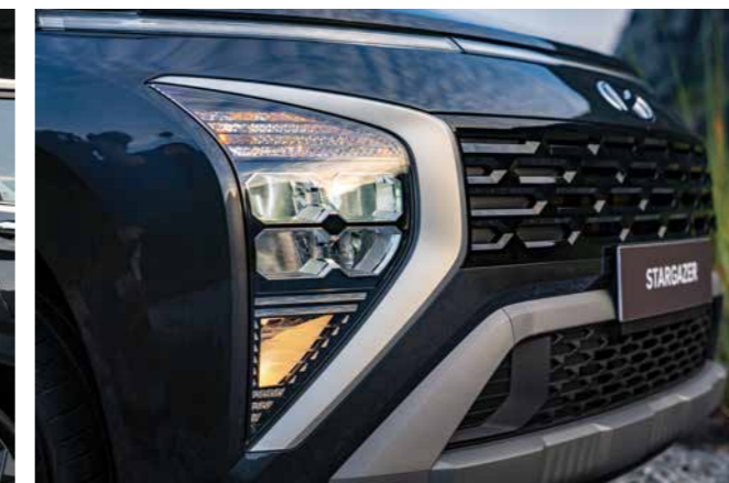
Đèn chiếu sáng LED (Phiên bản cao cấp/cao cấp 6 chỗ)