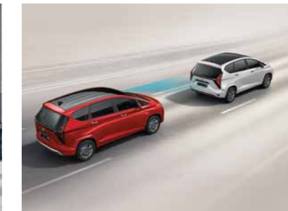
Cảnh báo phòng tránh va chạm phía trước