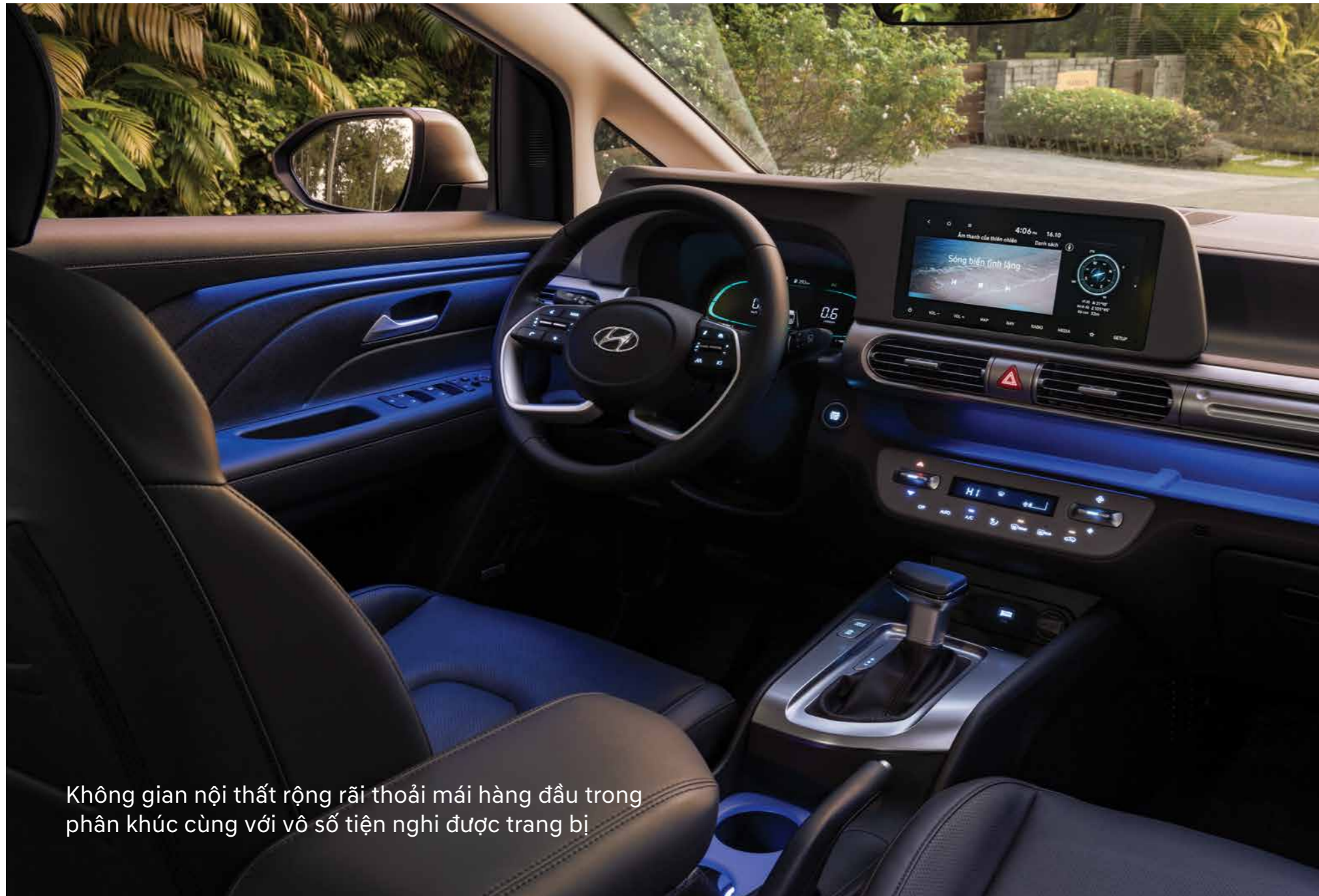
Không gian nội thất rộng rãi thoải mái hàng đầu trong phân khúc cùng với vô số tiện nghi được trang bị