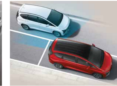
Cảnh báo mở cửa xe khi dừng đỗ