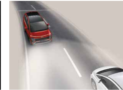
Đèn pha thông minh tự động bật tắt