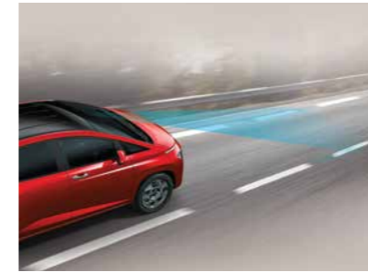
Hỗ trợ giữ làn đường

Hộp số CVT cải tiến cho hiệu quả tiết kiệm nhiên liệu +4.2% và dải tay số rộng hơn so với hộp số tự động 6 cấp đem đến trải nghiệm vận hành êm ái, độ ổn và rung động thấp hơn