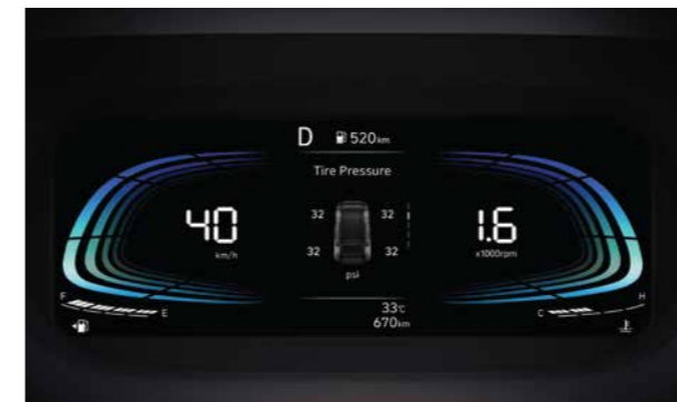
Cảm biến áp suất lốp có khả năng hiển thị giá trị áp suất của từng lốp