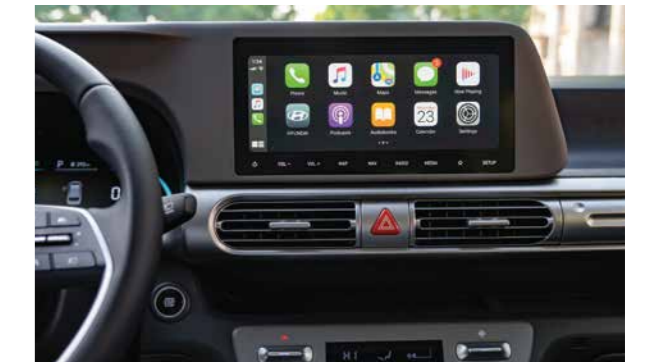
Kết nối Apple Carplay / Android Auto không dây