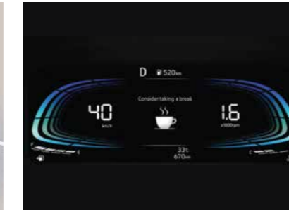
Cảnh báo người lái mất tập trung khi lái xe