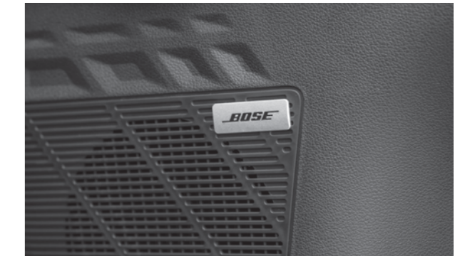
Hệ thống 8 loa Bose cho trải nghiệm âm thanh sống động ở phiên bản cao cấp