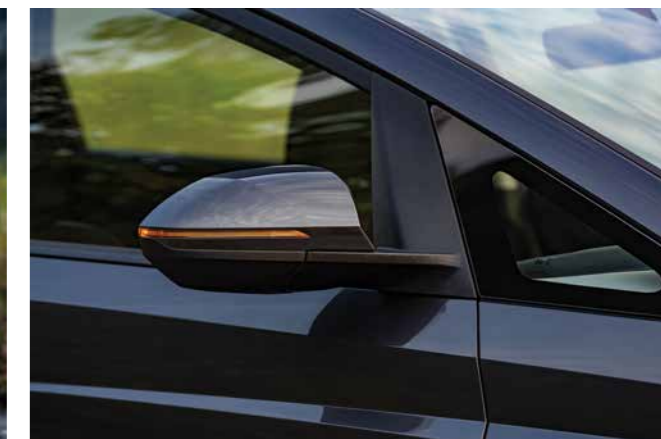
Xi nhan tích hợp trên gương tiện lợi