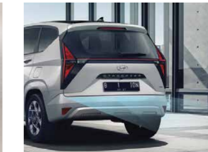
Cảm biến lùi hỗ trợ đỗ xe