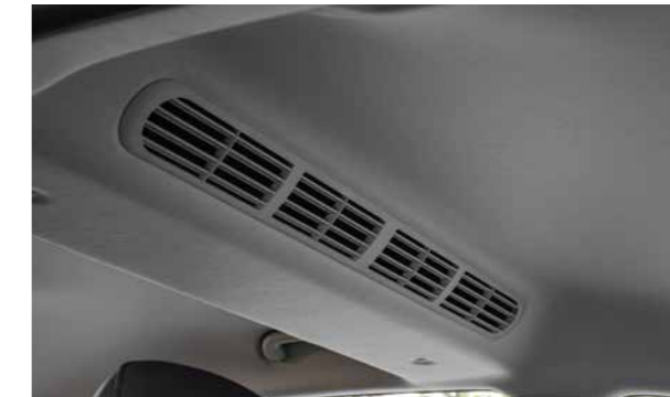
Cửa gió điều hoà hàng ghế sau được trang bị cùng với 4 hốc gió và 3 cấp độ của quạt gió giúp làm mát nhanh và sâu hơn