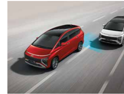
Cảnh báo điểm mù và phòng tránh va chạm