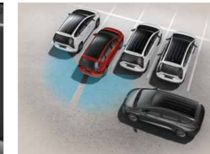
Cảnh báo và phòng tránh va chạm phía sau