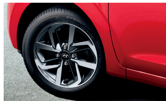
Hệ thống cảm biến áp suất lốp