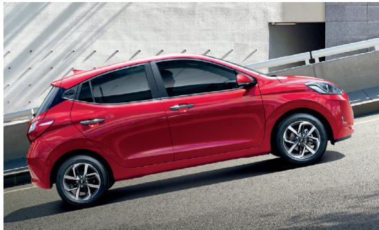
Hệ thống hỗ trợ khởi hành ngang dốc tích hợp với cân bằng điện tử