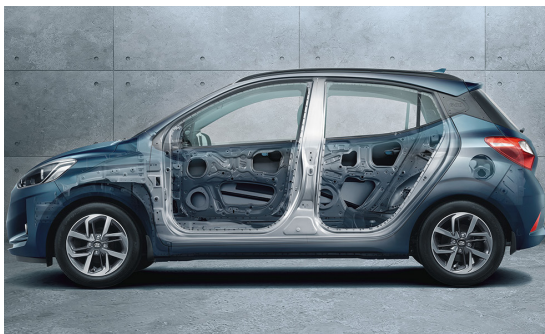
Hệ thống khung mới cứng vững hơn với thép cường độ cao AHSS