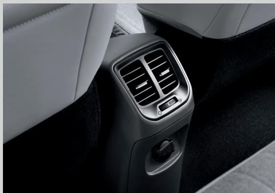
Cửa gió điều hòa hàng ghế thứ 2