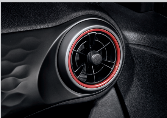
Cửa gió điều hòa dạng tua bin với 2 tông màu trẻ trung