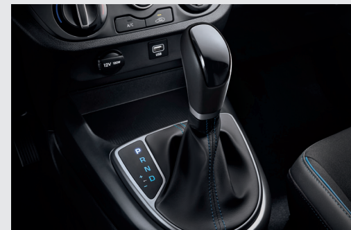
Hộp số tự động 4 cấp

Được tối ưu để tạo nên sự cân bằng giữa niềm vui lái xe và khả năng tiết kiệm nhiên liệu