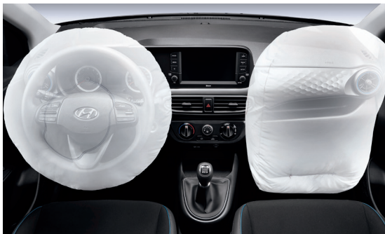
Hệ thống an toàn 2 túi khí

Mang đến khả năng vận hành bền bỉ và tiết kiệm nhiên liệu