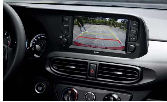
Camera lùi hỗ trợ đỗ xe