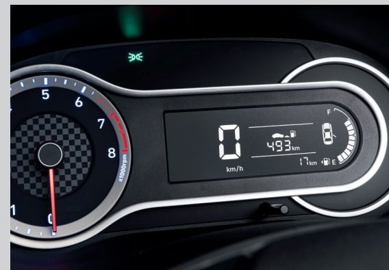
Màn hình thông tin thiết kế thể thao