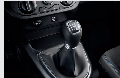
Hộp số sàn 5 cấp

Mang đến khả năng vận hành bền bỉ và tiết kiệm nhiên liệu