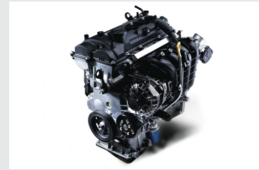
Động cơ Kappa 1.2L mang đến khả năng vận hành êm ái, ổn định cùng với khả năng tiết kiệm nhiên liệu nhưng vẫn đáp ứng được nhu cầu vận hành của khách hàng.