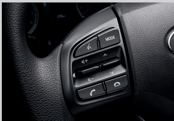
Cụm điều chỉnh media tích hợp nhận diện giọng nói