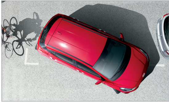
Cảm biến va chạm phía sau