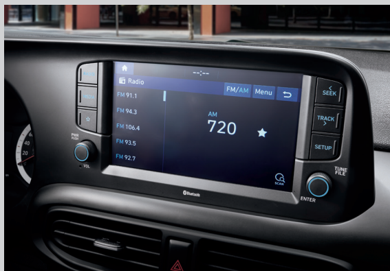
Màn hình giải trí 8 inch