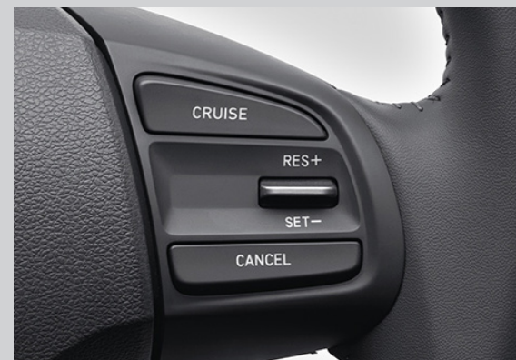
Điều khiển hành trình